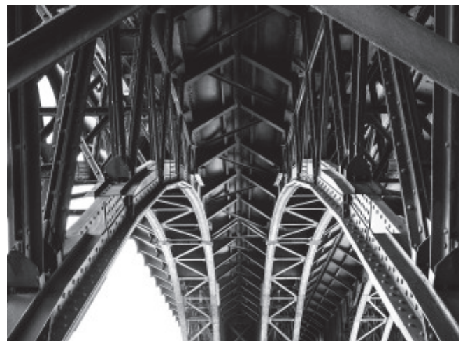
Die Fachwerkbögen des Chemnitzer Viaduktes verfügen über eine ausreichende Restlebensdauer [4]

Prof. Marx und Koautoren beschäftigen sich in der genannten Arbeit im Wesentlichen mit der messtechnischen Ermittlung des Bean-